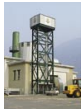
Vedute della centrale di teleriscaldamento di Tirano

La Centrale di Tirano è il primo impianto in Italia di cogenerazione a biomassa capace di produrre sia calore che energia elettrica.