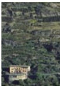
Caratteristiche vigneti terrazzati della Valtellina nella zona vitivinicola del Sassella

La Fondazione ProVinea "Vita alla vite di Valtellina" ONLUS, costituita a Sondrio nel 2003 su iniziativa del Consorzio di Tutela dei Vini di Valtellina, riunisce tutta la filiera vitivinicola con oltre 1000 viticoltori ed il 100% delle cantine valtellinesi.